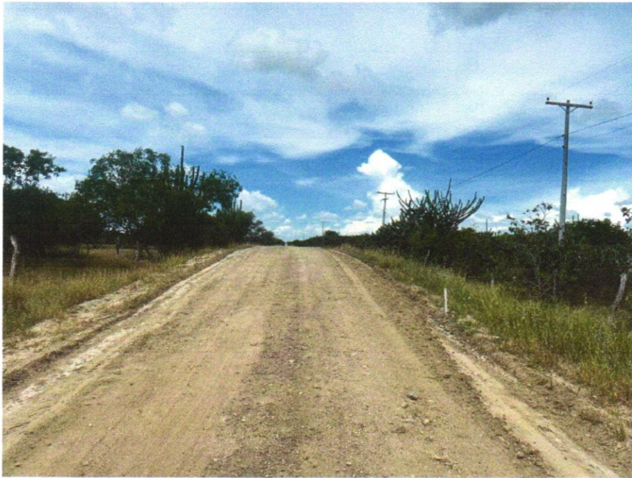
FOTO 01 – REGULARIZAÇÃO DE SUPERFÍCIES COM MOTONIVELADORA. AF_11/2019

EMPREENDIMENTO Recuperação de Estradas Vicinais