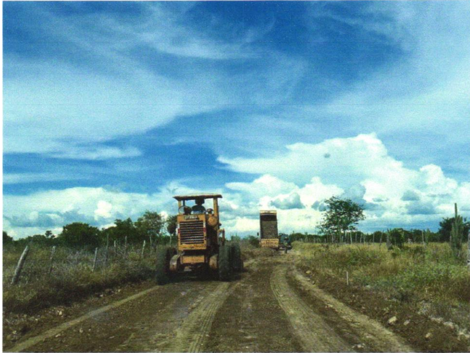
Foto 05- ESPALHAMENTO DE MATERIAL COM TRATOR DE ESTEIRAS. AF_11/2019

EMPREENDIMENTO Recuperação de Estradas Vicinais