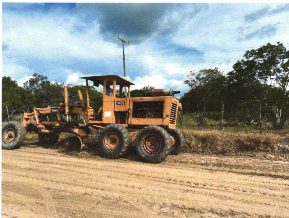
Foto 08- ESPALHAMENTO DE MATERIAL COM TRATOR DE ESTEIRAS. AF_11/2019

Wendel Simões Goy CNPJ 07.749.778/0001-00 ENGENHARIA LTDA. Rua Francisco Ribeiro, 808 - Goiás CEP 74.203-110 - Goiânia - Goiás