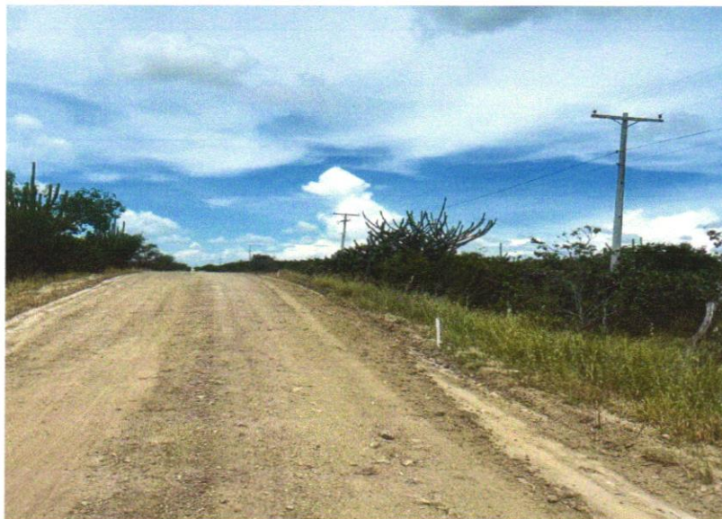
FOTO 02 – REGULARIZAÇÃO DE SUPERFÍCIES COM MOTONIVELADORA. AF_11/2019

Wendel Simões Cruz CPF: 749.776/0001- ARL/ENGENHARIA LTDA RUA Aristóteles Pinheiro, 806 - Graças CEP: 62.125-110 - Santana - BEH