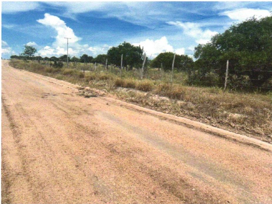
Foto 06- EXECUÇÃO E COMPACTAÇÃO DE ATERRO COM SOLO PREDOMINANTEMENTE ARGILOSO - EXCLUSIVE SOLO, ESCAVAÇÃO, CARGA E TRANSPORTE. AF_11/2019

Wendel Simões Cruz CPF 749.778/0001- ARV ENGENHARIA LTDA RUA FRANCISCO PIMENTA, 806 - Centro CEP 62.100-000 - Santa Luz - BE