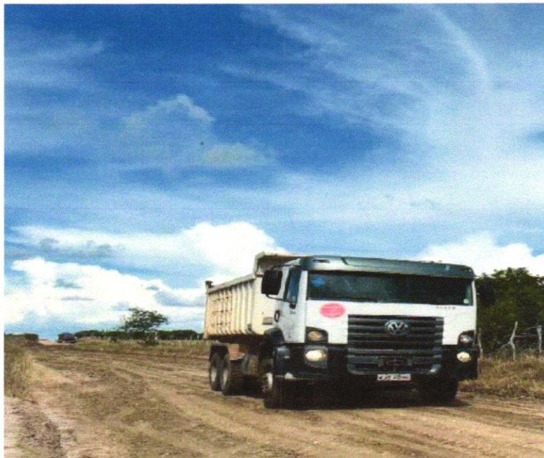
Foto 07 - TRANSPORTE COM CAMINHÃO BASCULANTE DE 10 M 3 , EM VIA URBANA EM LEITO NATURAL (UNIDADE: M3XKM). AF_07/2020

EMPREENDIMENTO Recuperação de Estradas Vicinais