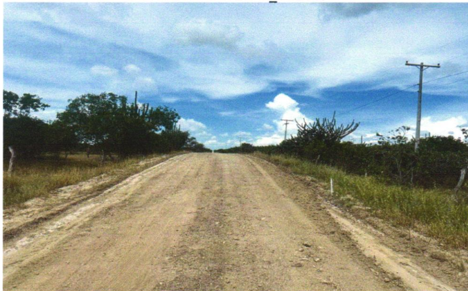
Foto 10 - EXECUÇÃO E COMPACTAÇÃO DE ATERRO COM SOLO PREDOMINANTEMENTE ARGILOSO - EXCLUSIVE SOLO, ESCAVAÇÃO, CARGA E TRANSPORTE. AF_11/2019

Wendel Simões Cruz 13 749.775/0001-00 ENR 5 ENGENHARIA LTDA. RUA PROLATAÇÃO RIBEIRO, 806 - Jardim I - CEP 13.160-000 - Santa Luz - SP