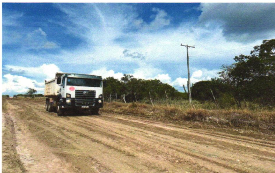
FOTO 04 - TRANSPORTE COM CAMINHÃO BASCULANTE DE 6 M 3 , EM VIA URBANA EM LEITO NATURAL (UNIDADE: M3XKM). AF_07/2020

Wendel Simões Cruz CPF: 749.775/0001-0 RUA: S/GERMÂNIA LTDA RUA: INACIÃO FERREY, 806 - Centro CIP: 05.853-110 - SantaLuz - PA