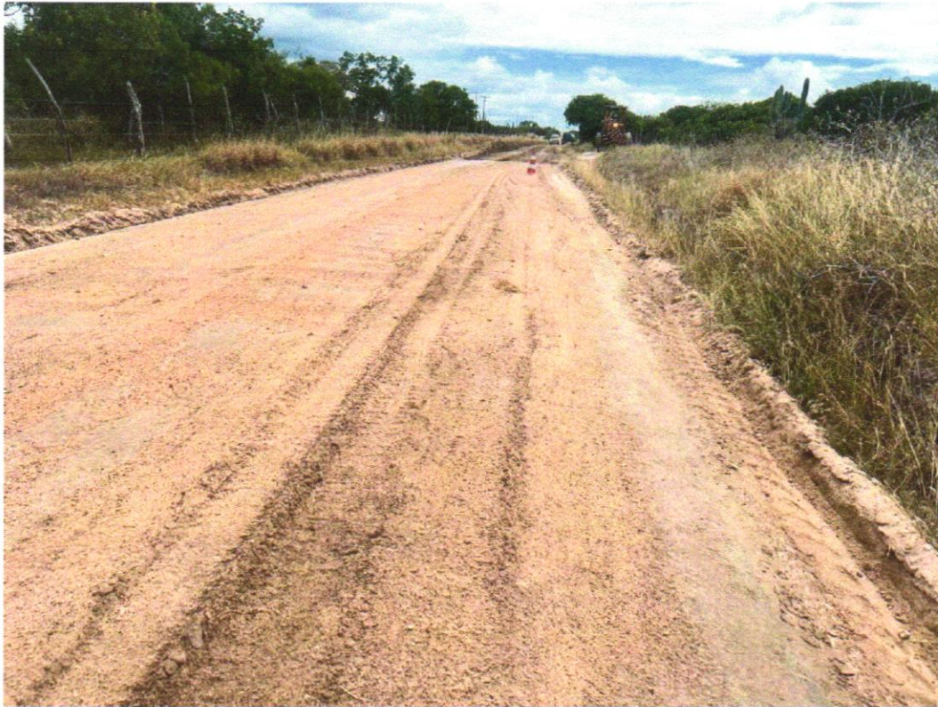
Foto 09 - EXECUÇÃO E COMPACTAÇÃO DE ATERRO COM SOLO PREDOMINANTEMENTE ARGILOSO - EXCLUSIVE SOLO, ESCAVAÇÃO, CARGA E TRANSPORTE. AF_11/2019

EMPREENDIMENTO Recuperação de Estradas Vicinais