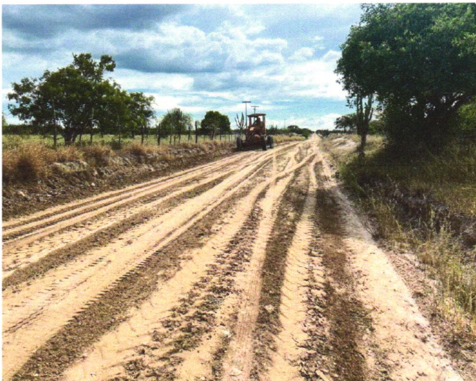
FOTO 03 - ESCAVACAO E CARGA MATERIAL 1A CATEGORIA, UTILIZANDO TRATOR DE ESTEIRAS DE 110 A 160HP COM LAMINA, PESO OPERACIONAL * 13T E PA CARREGADEIRA COM 170 HP

EMPREENDIMENTO Recuperação de Estradas Vicinais